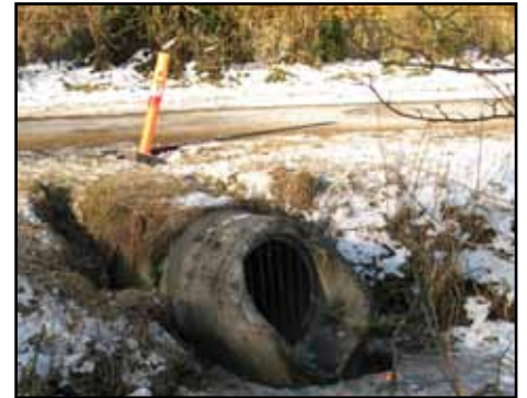
Kloakudløb fra Gladsaxe til Mosen