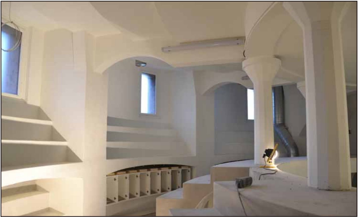
I rummet under kuppelsalen er der etableret bade- og omklædningsfaciliteter. Et fantastisk rum med søjler og terrasserede hylder og nicher