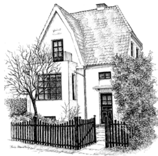
Sidste års modtager af Imbris prisen Engblommevej 2B

Også i år har Imbris-udvalget fundet en værdig prismodtager, som får tildelt en flot indrammet tegning af det præmierede.