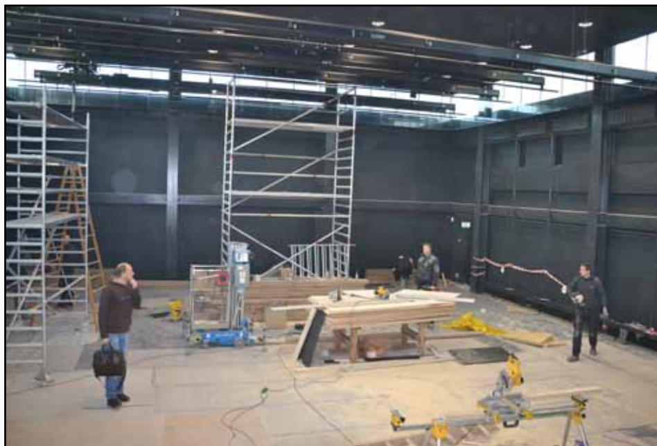
Det store danselokale med sorte vægge og loft og et gennemgående vinduesbånd oppe under tagkonstruktionen

Transformationen fra krematorium og kapel, som vi jo forbinder med dystre og sørgelige begivenheder, til et nyt danse- og bevægelseshus, der forbindes med liv og glæde gav mange overvejelser om etik og gravfred med beliggenheden så tæt op ad kirkegården. Det emne har da også været debatteret lokalt i medierne.