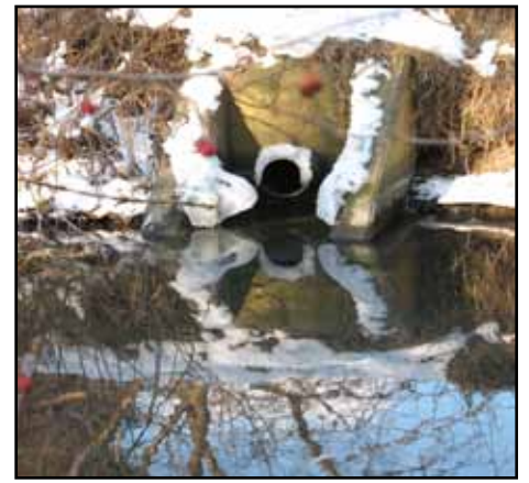
Kloakudløb til Nordrenden

D: Her ligger regnvandsbassinerne, hvor det regnvandsfortyndede spildevand opsamles, inden det pumpes gennem kloaksystemet. Hvis bassinerne fyldes og løber over, ledes spildevandet ind i mosen gennem rensningsanlægget i den østlige del af Vestmosen ved Hillerød motorvejen