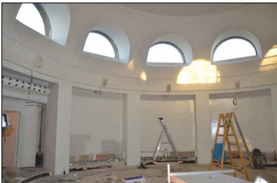
Den store kuppelsal i Dansehuset med nicher, hvor der skal monteres bænke og oven over er der en række buede vinduer, der giver et fint lys