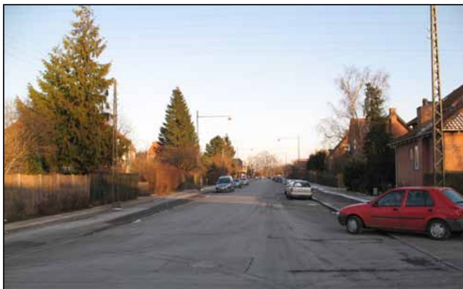
Grønnemose Allé med god plads til allé træer