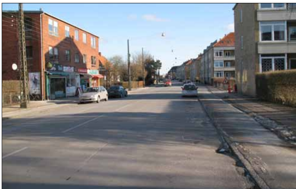
Emdrupvej bliver med de nye tiltag et sikrere sted at færdes