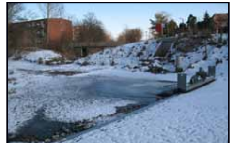
Opstemningen ved Dunhammervej og udløbet til Søborghusrenden.