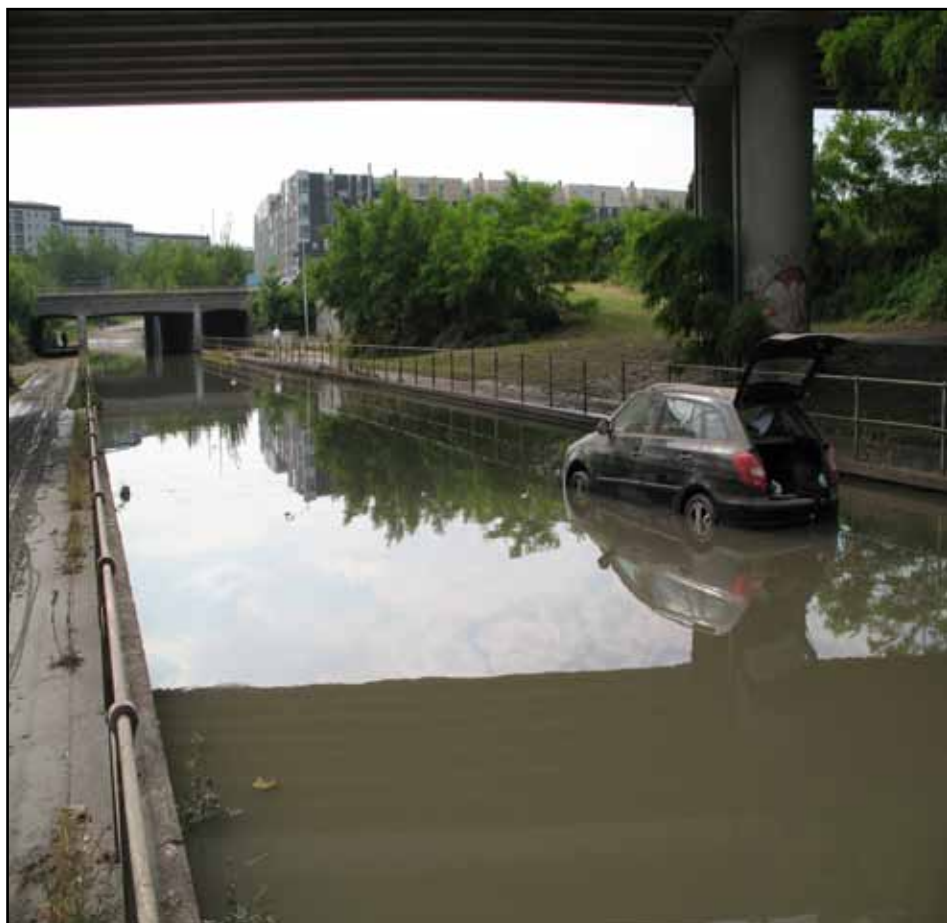
Lersø Parkalle efter skybrud 2011