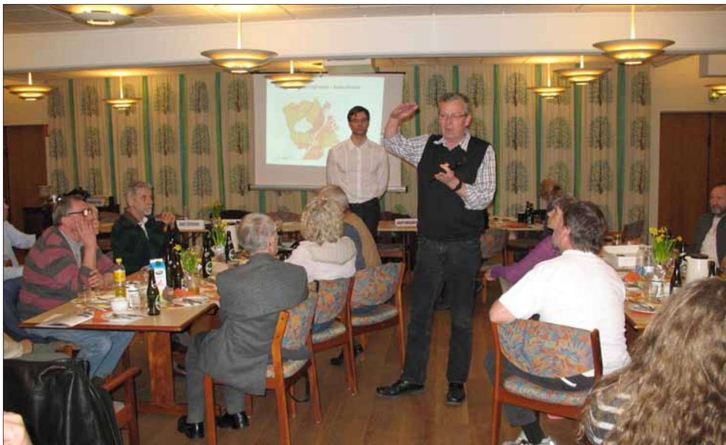
Generalforsamlingen 2012. Indlæg om skybrud og klimænderinger