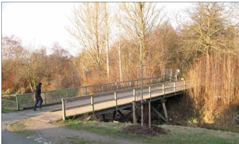
De gamle træbroer ved Dunhammervej

husrenden bruges af ca. 17.000 biler i døgnet. Den lider af manglede vedligeholdelse, og skal renoveres for et større beløb i 2013 og 2014.