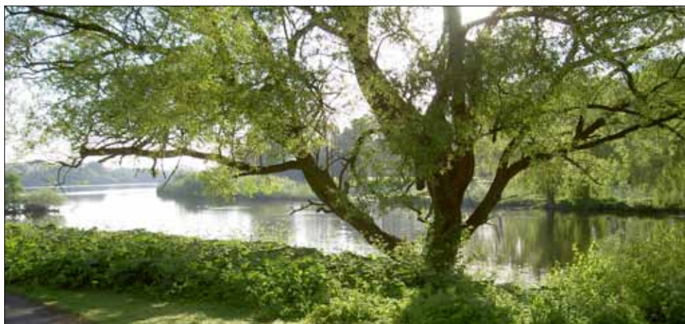
Parti fra Vestmosen