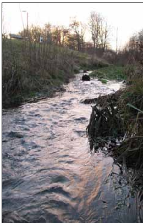
Søborghus Renden ved Dunhammervej

De store syndere med hensyn til udledning har imidlertid været Gentofte Kommune og navnlig Gladsaxe Kommune.