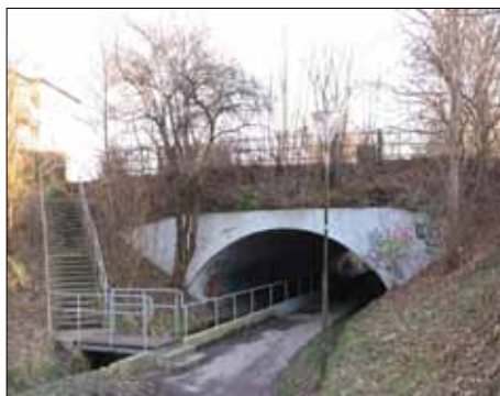
Broen ved Frederiksborgvej

husrenden bruges af ca. 17.000 biler i døgnet. Den lider af manglede vedligeholdelse, og skal renoveres for et større beløb i 2013 og 2014.