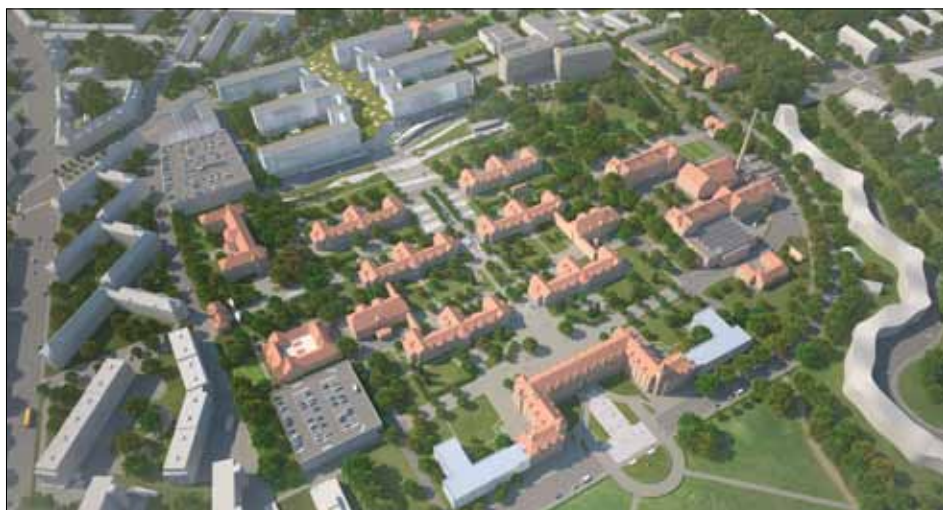
Oversigt over Nyt Bispebjerg Hospital

Psykiatrien opføres som nybyggeri i 2-3 etages bygninger mod øst på de arealer, hvor den eksisterende psykiatri i dag er beliggende. Arealerne med haveanlæg i det historiske kvarter er fredede, dermed fastholdes samspillet mellem de grøn-