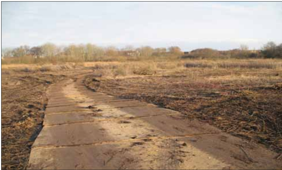
Det ryddede område i Højmosen