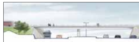
Cykel- og gangbro over Nordhavnsvej

I Emdrup Øst er Københavns Kommune ved at bygge to stibroer, så cyklister og gående kan krydse over både Helsingørmotorvejen og Nordhavnsvej lige nord for Ryparken Station.