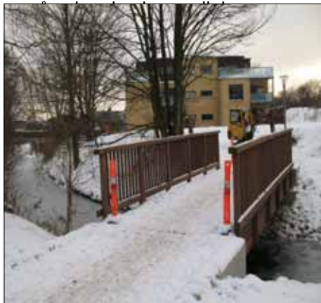
Ny træbro ved Lundedalsvej

Broen vil gøre det nemmere for cyklister