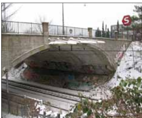
Broen over S-banen på Emdrupvej

I budgettet for 2013 er der sat et betydeligt beløb af til genopretningen af broen over Frederiksborgvej og Emdrupvej. Samlet er der afsat 96 millioner til renovering af broerne og rådgiverne er ved at udforme projektet. Det forventes at arbejdet er færdigt i løbet af 2013-2014.