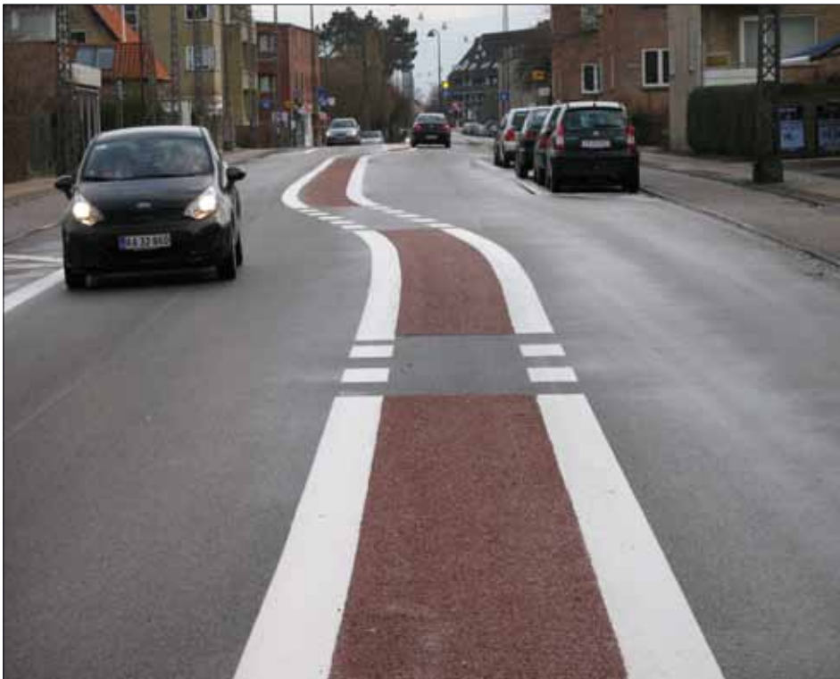
Trafiksnering af Emdrupvej med den svingende nye midterrabat