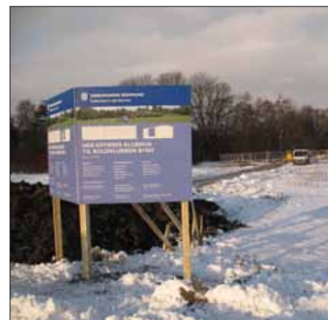
Det nye klubhus ved Grønnemose Alle

Det gamle klubhus, som ligger skråt over for Gartnerhuset på stiarealet ved Mosen, skal efter planen rives ned når det nye står færdigt.