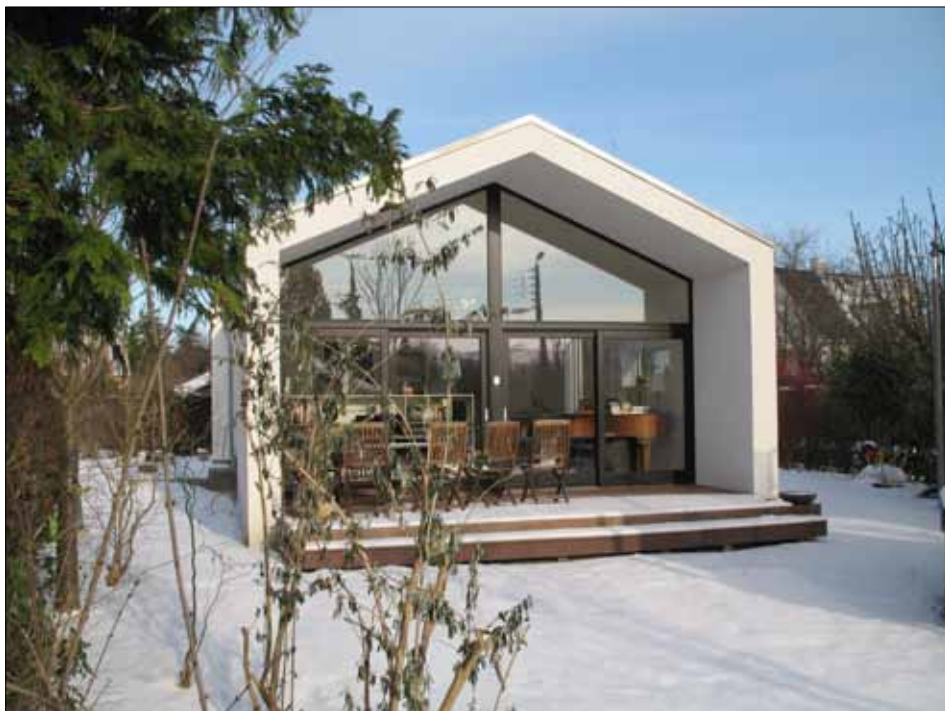
Imbris-prisen 2012. Engblommevej 12

Det har alt sammen givet det mindre hus fra 1954 et gevaldigt løft. Man har bibeholdt formen som længehus – men man har forlænget huset i gavlen mod syd og i gavlen isat et stort glasparti og samtidig skabt en overdækket terrasse, så man kan sidde ude uberørt, når duggen falder.