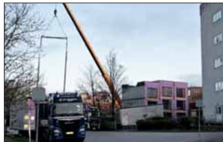
Byggeriet ved Lundedalsvej