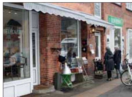
Fransk stemning på Frederiksborgvej