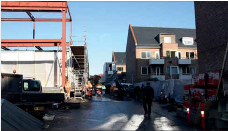
Byggeriet af Emdrupvej 22 er forlængst gået i gang trods klagesagen