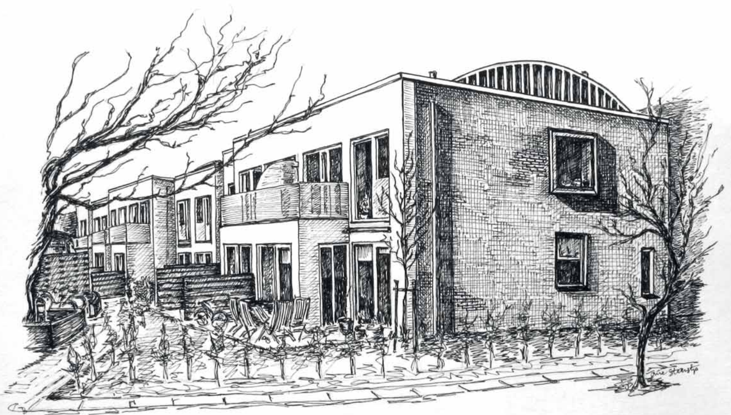
Forskønnelsesprisen 2017 - Frederiksborgvej 209 Tegning Trine Steenstrup