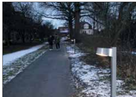
Ny belysning ved Søborghus

Det var planen, at der i 2016 skulle foretages en evaluering i kommunen af den store omlægning af gadebelysning, som er sket i hele byen. Den vil bestyrelsen spørge til. Har man konkrete problemer med belysningen, kan man rette henvendelse til Teknik- og Miljøforvaltningen.