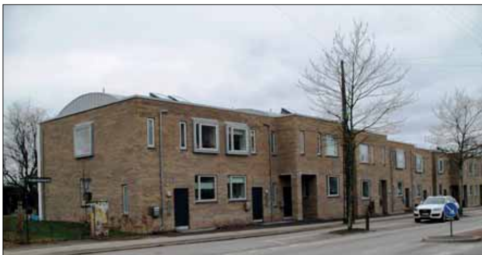
Imbris-prisen 2017: Frederiksborgvej 209-213

Frederiksborgvejs rå murstens krop er borte, og i stedet er muren glat og hvid.