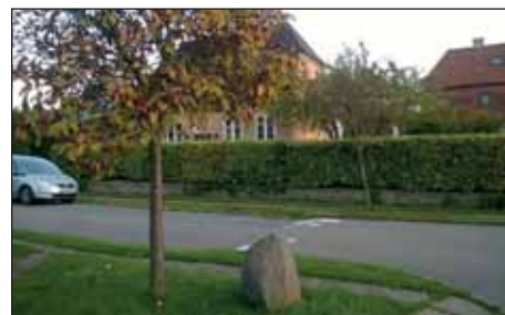
Vejlaug Firkløveret – Privat fællesvej

Efterskrift: For 2 år siden fik alle medlemmer af Emdrup Grundejerforening et ek-