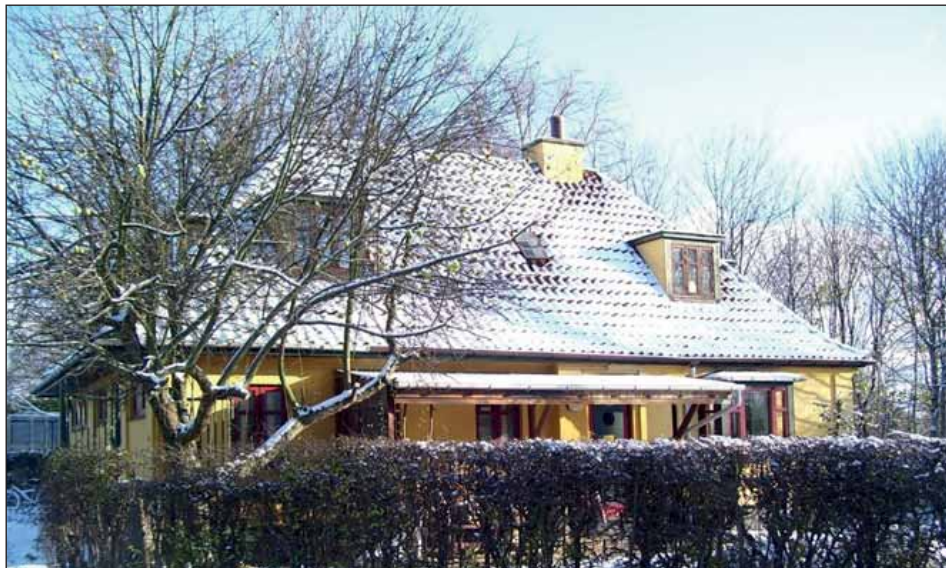
Karens Hus på Bispebjerg Bakke 8 i vinterdragt