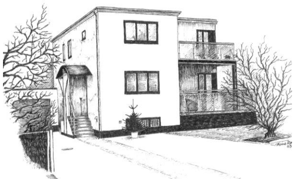
Imbrisprisen 2004, Oldfuxvej 8

Også i år har Imbris-udvalget fundet en værdig prismodtager, som får tildelt en flot indrammet tegning af det præmierede.