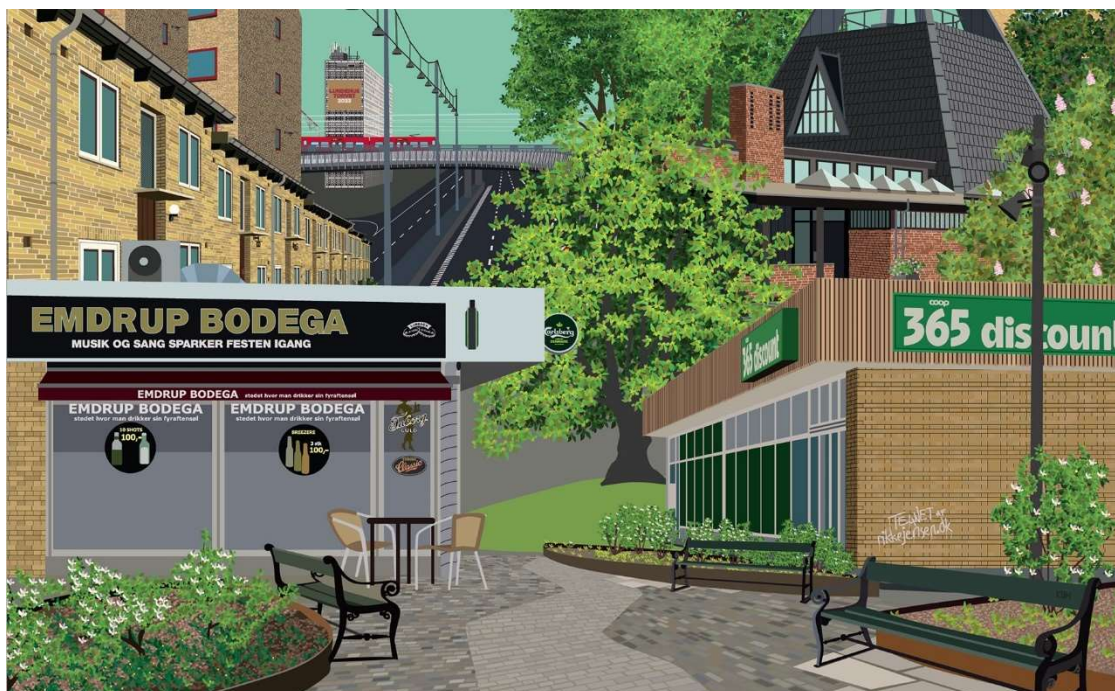
Tegning: Rikke Jensen